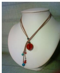
紐を変えてパーツを加えると新品同様に！